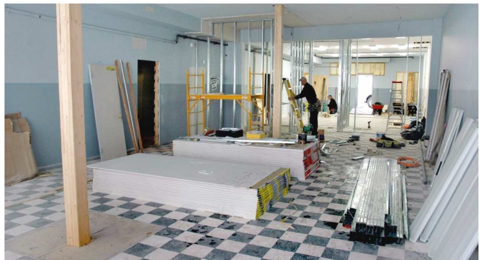
Les rénovations majeures à la plomberie et au système de ventilation sont terminées au site du futur Café. Il ne reste qu'à moderniser le système d'électricité, ce qui fut entamé le 31 octobre. La finition des murs et le déménagement du mobilier et de l'équipement de cuisine se fera rapidement par la suite. Consultez la page L'Arche Café sur le site web de L'Arche Winnipeg pour toute information concernant la date d'ouverture du Café.

et The Olive Garden. Grand merci aussi à tous nos bénévoles, aux membres du comité organisateur, et à tous les donateurs et donatrices qui ont assuré le succès du troisième déjeuner «Cercle de l'espoir» de L'Arche Winnipeg.