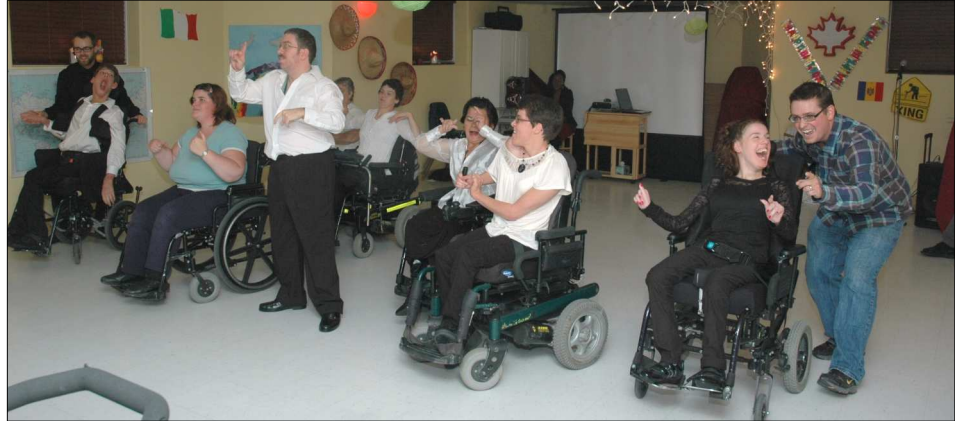
Le groupe de danse "All Abilities" à notre soirée de L'Arche du mois d'octobre.

Les présentations, d'une durée de 15 à 30 minutes, comprennent vidéo, informations concernant L'Arche et les possibilités d'engagement comme bénévole, donateur, ou assistant dans une de nos maisons.